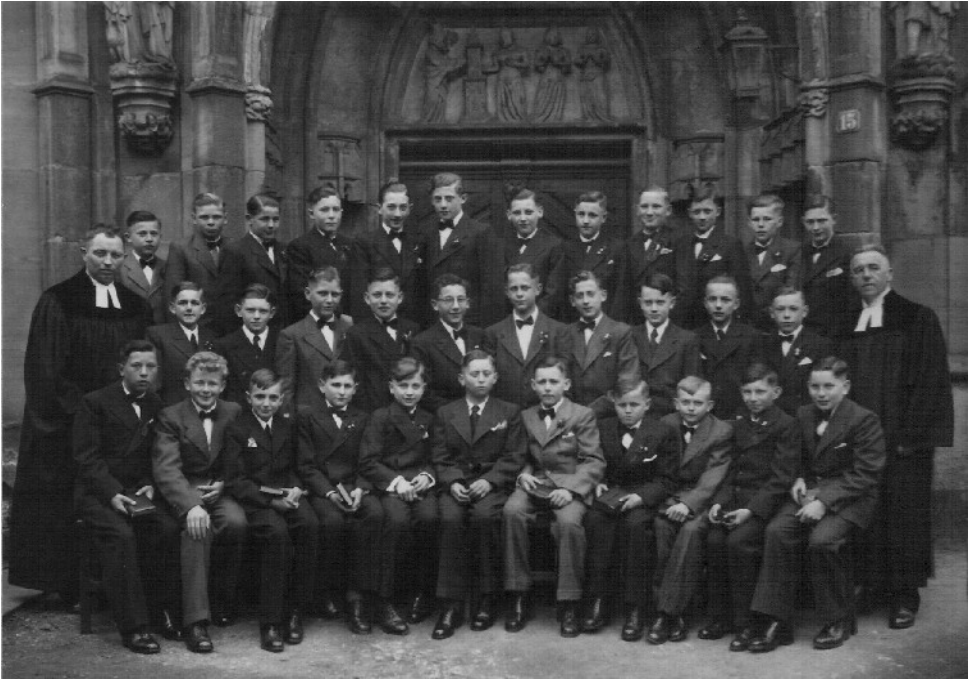
Die Konfirmanden des Jahres 1942